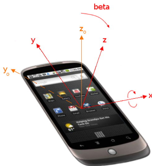
Abbildung 5: Smartphone mit dem Lagewinkel beta (Querachse). (Illustration: W3C)