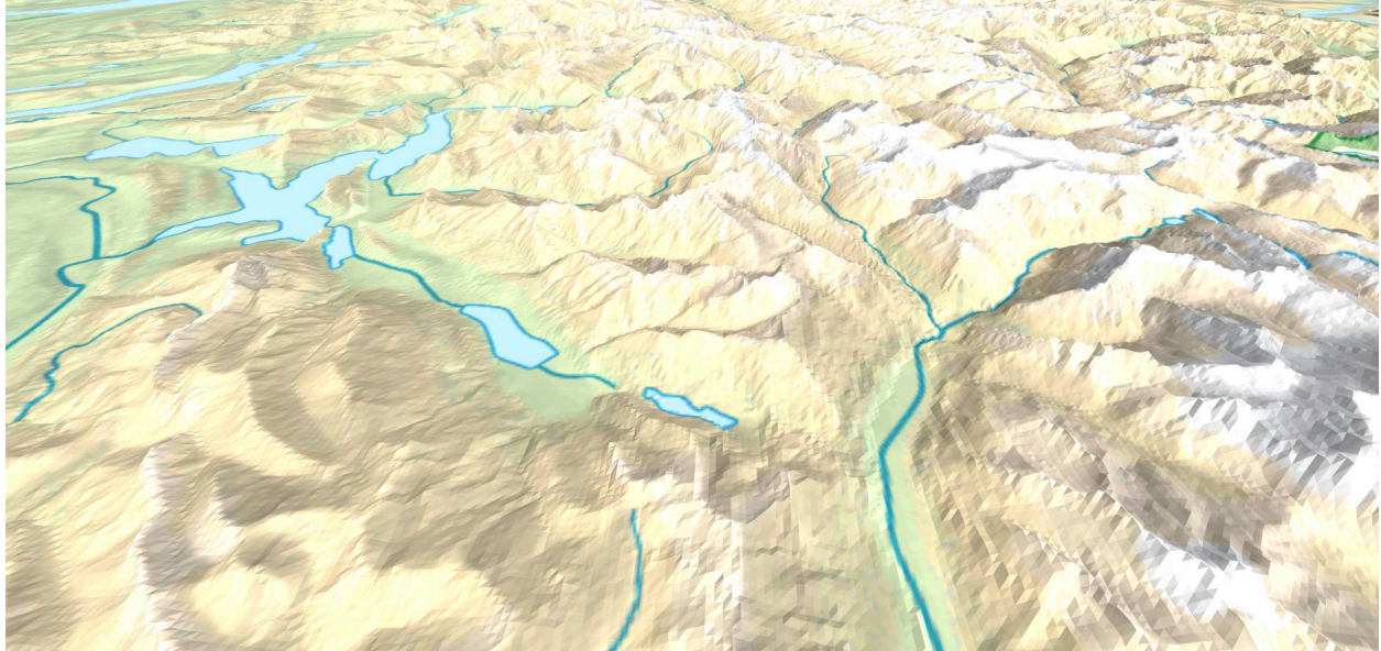
Abbildung 1: Digitales Höhenmodell der Schweiz auf der Basis eines räumlichen 200-m-Gitternetzes; Ansicht vom Lungernsee (untere Bildschirmmitte) in Richtung Osten. (Eigene Darstellung)