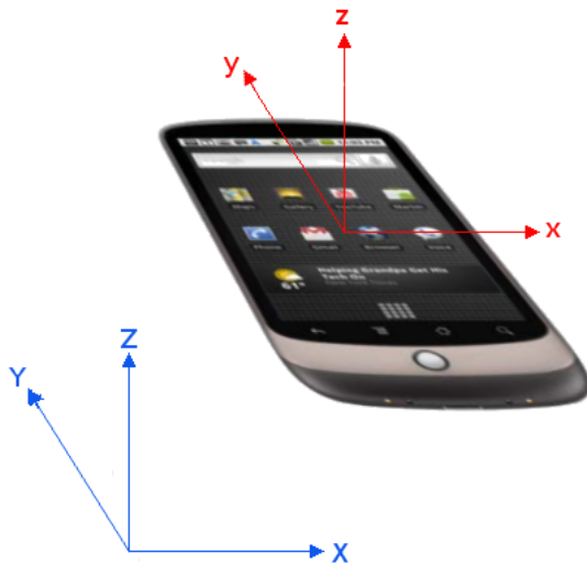
Abbildung 3: Smartphone mit den drei Raumachsen x , y und z . (Illustration: W3C)

Lage-/Beschleunigungssensoren und Gyroskop ermöglichen gemäss W3C-Spezifikation 19 das Auslesen der räumlichen Orientierung des Geräts entlang der drei Raumachsen x , y und z mithilfe des Eventlisteners deviceorientation und in den drei Lagewinkeln alpha , beta und gamma .