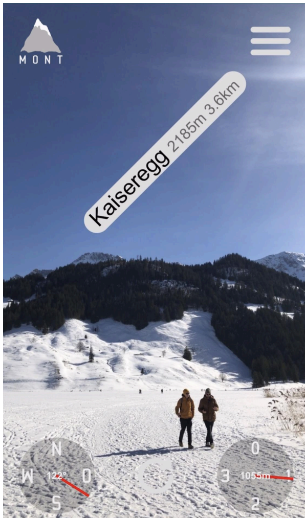
Abbildung 2: Screenshot der Webapp MONT (Blick vom Schwarzsee FR nach Südosten, eigene Darstellung)

offline, etwa in unwegsamem Gelände ohne hinreichenden Datenempfang, funktionsfähig und muss zur erneuten Verwendung nicht neu geladen werden.