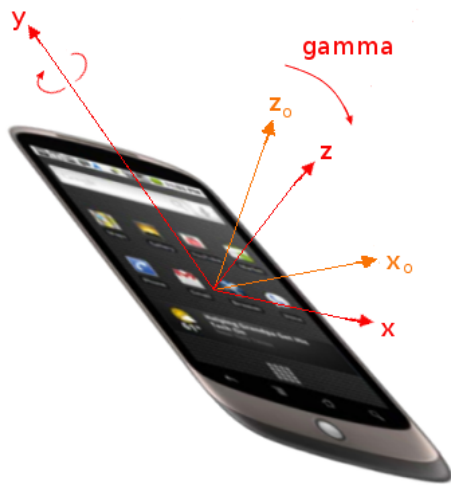
Abbildung 6: Smartphone mit dem Lagewinkel gamma (Längsachse). (Illustration: W3C)